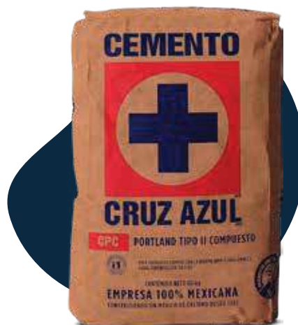
Saco | 50 Kg

Somos los únicos que producimos Cemento Tipo II con características químicas que brindan mayor desempeño, durabilidad, resistencia al ataque químico y físico con bajo calor de hidratación.