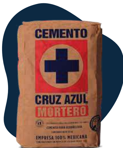
Saco | 50 Kg